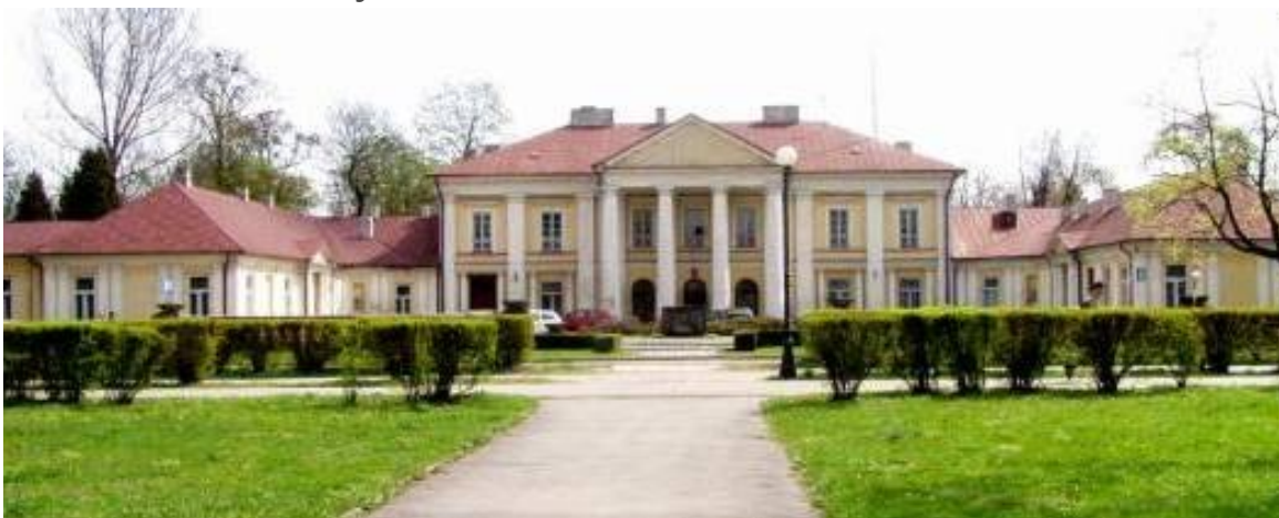
Widok Pałacu Ogińskich za lat 90, XX w.