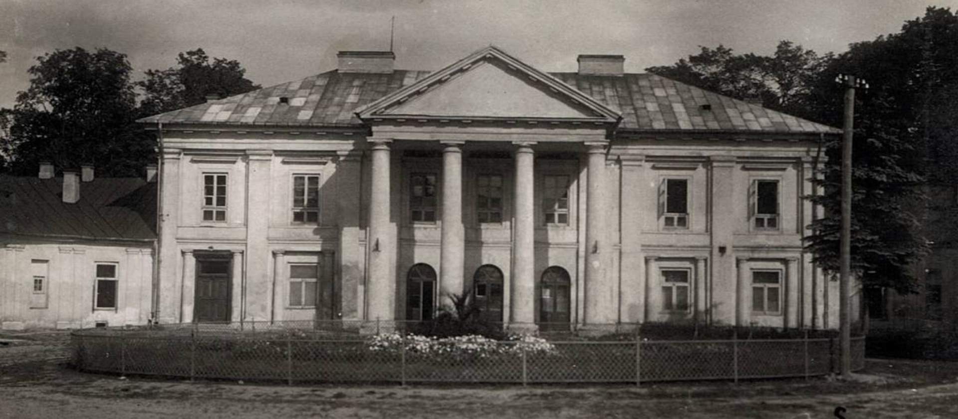
Pałac Ogińskich, ok.1929 roku.