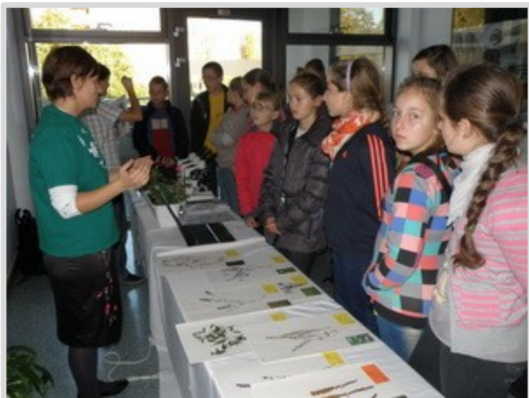
Festiwal Nauki i Sztuki