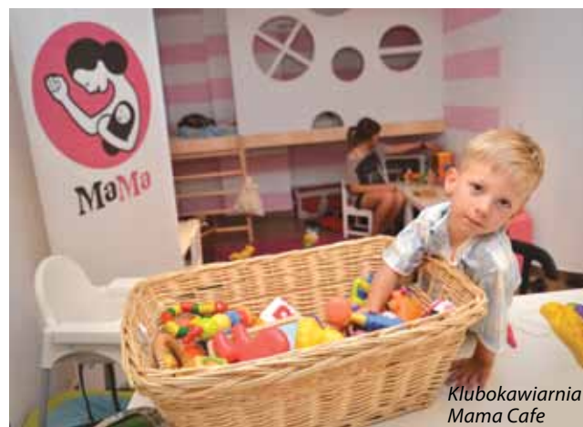
Klubokawiarnia Mama Cafe

W każdym indywidualnym przypadku ważna jest „historia” danego podmiotu, jego współpraca z instytucjami finansowymi, ale także sposób wykorzystania i rozliczania dotychczasowych dotacji. Opracowywane są procedury poręczeń przez m.st. Warszawa udzielanych instytucjom finansowym (np. pożyczki pomostowe są w PAFPIO niżej oprocentowane, jeśli m.st. Warszawa je poręczy, dotyczy to również kredytu uzupełniającego udzielanego przez BOŚ). Dlatego tak istotnym elementem jest wdrożenie II Produktu, wchodzącego w skład wypracowanego zintegrowanego systemu narzędzi i mechanizmów wspierających IES, jako stabilnego partnera w realizacji zadań publicznych.