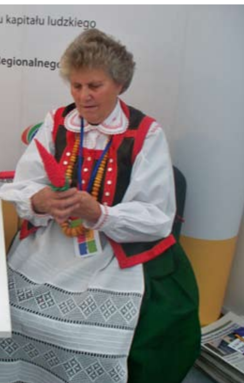
Kurpiowskiego Stowarzyszenia Twórców Ludowych