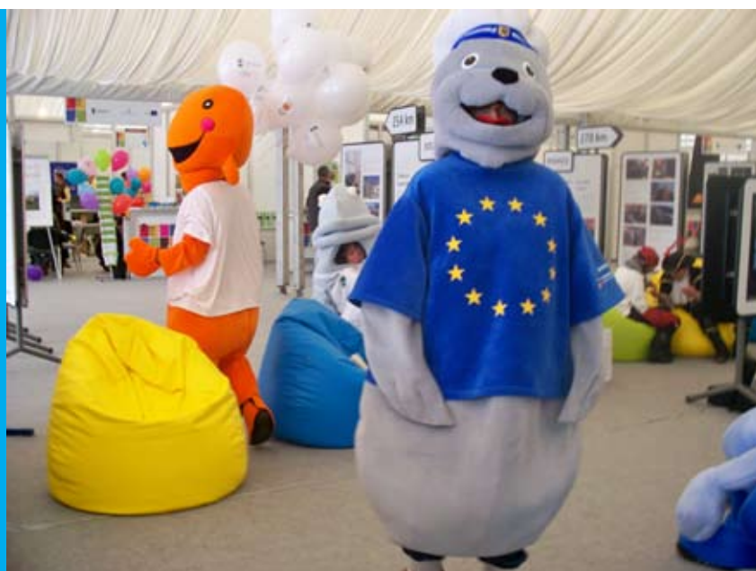
Maskotki funduszy europejskich