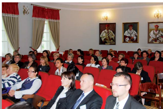
Uczestnicy konferencji w Siedlcach.