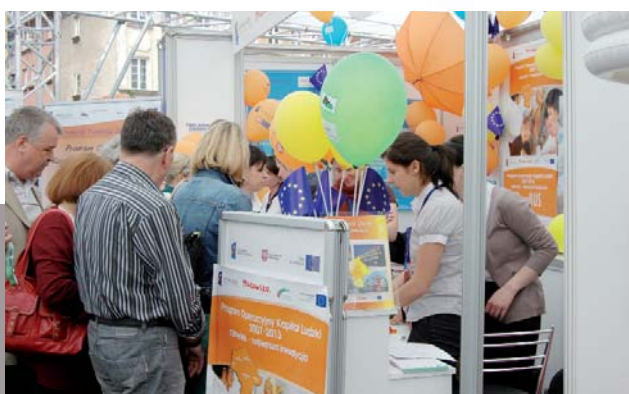
Stoisko MJWPU cieszyło się dużym zainteresowaniem.

Tym bardziej, że Forum odbyło się w roku 2009, czyli w piątą rocznicę przystąpienia Polski do Unii Europejskiej. W części konferencyjnej przedstawiciele Ministerstwa Rozwoju Regionalnego, eksperci oraz przedsiębiorcy dyskutowali na temat wsparcia beneficjentów z Funduszy Europejskich oraz roli środków unijnych w dobie kryzysu. Podsumowano także doświadczenia w korzystaniu z pomocy UE na przestrzeni ostatnich pięciu lat. Podczas piątkowej gali ogłoszono listę laureatów w konkursach: EUROLIDER 2009 oraz „Polska pięknieje. 7 cudów Funduszy Europejskich”. Nagrody wręczał Pan Premier Donald Tusk oraz Pani Minister Rozwoju Regionalnego Elżbieta Bieńkowska. Natomiast na Placu Zamkowym, dla wszystkich zainteresowanych, powstało miasteczko informacyjne, kino Funduszy Europejskich oraz namioty, w których prowadzone były otwarte wykłady. Na ponad 80 stoiskach wystawienniczych zaprezentowały się instytucje z całej Polski zajmujące się wdrażaniem programów współfinansowanych ze środków europejskich. Mazowiecka Jednostka Wdrażania Programów Unijnych – wspólnie z Wojewódzkim Urzędem Pracy w Warszawie