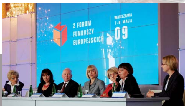
Wśród prelegentów między innymi Pani Komisarz Danuta Hübner.