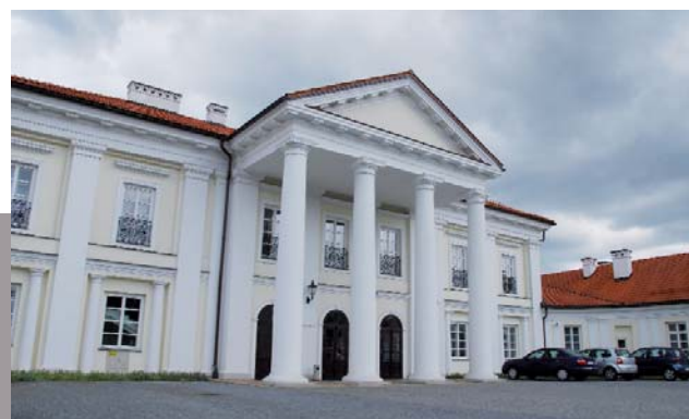
Konferencja w Siedlcach odbyła się w pięknym pałacyku Ogińskich.

Podczas Konferencji odbyła się projekcja filmu pt.: „Klinika Sukcesu” przedstawiającego projekt realizowany na terenie Radomia i okolic. Celem projektu było zwiększenie aktywizacji zawodowej osób zagrożonych marginalizacją oraz promocja aktywności zawodowej w regionie radomskim. Film przedstawiał eksperymentalną grupę bezrobotnych, którzy na oczach widzów zmieniają swój styl działania tak, aby stać się atrakcyjnymi na rynku pracy, aby nadażyć za potrzebami pracodawców.