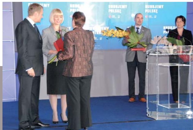
Nagrody Euroliderom wręczyli: Pan Premier Donald Tusk oraz Pani Minister Elżbieta Bieńkowska.

– reprezentowała województwo mazowieckie. Oprócz publikacji dotyczących Programu Operacyjnego Kapitał Ludzki, wszyscy zainteresowani mogli uzyskać informacje podczas indywidualnych rozmów z ekspertami. Wśród gości odwiedzających stoisko MJWPU szczególnym zainteresowaniem cieszył się poradnik „ABC Fundusze dla Mazowsza”.