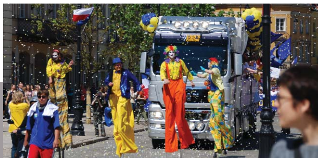
Paradzie sprzyjała nie tylko pogoda, ale przede wszystkim radosny nastrój uczestników.